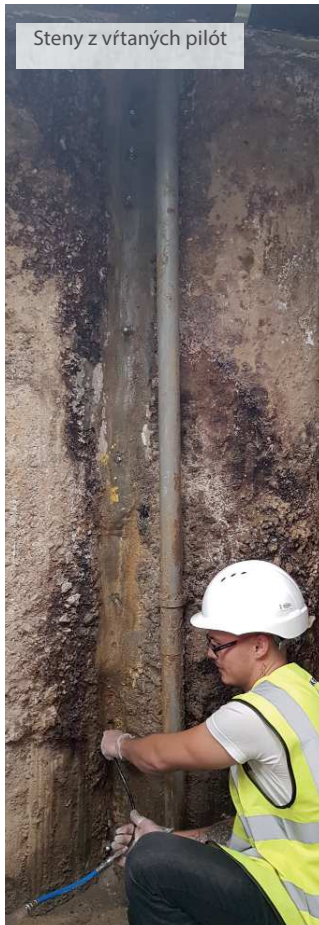
Steny z vŕtaných pilót