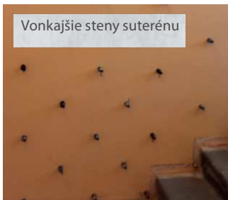
Vonkajšie steny suterénu