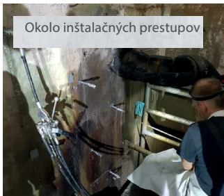
Okolo inštaláčnych prestupov