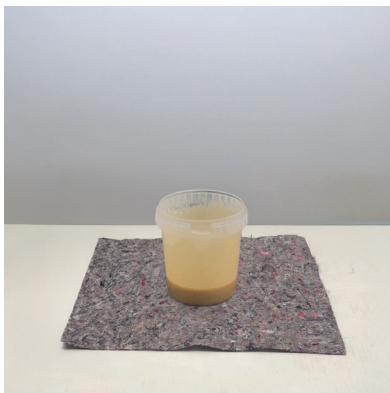
Inicio de la reacción aprox. 30 seg.