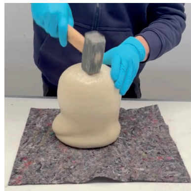
Gran estabilidad mecánica