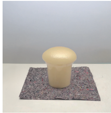
Tiempo de reacción total aprox. 150 seg.