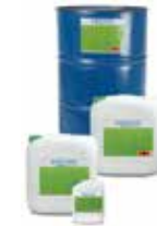
KÖSTER Mautrol 2K