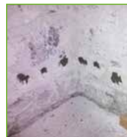
Anschließend werden die Bohrlöcher mit KÖSTER KB-Fix 5 verschlossen.