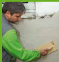
Abreiben der Oberfläche

KÖSTER Sanierputze sind in grau oder weiß erhältlich. Sie können, z. B. in historischen Gebäuden, als dekorativer Putz eingesetzt oder mit einer dampfdiffusionsoffenen Farbe überstrichen werden. KÖSTER Sanierputze sind für Innen- und Außenbereiche geeignet.