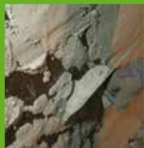
Aufbringen des KÖSTER Sanierputzes