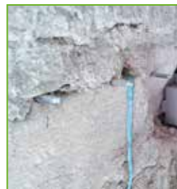
Bis zur Gelphase, die nach 45-60 Minuten einsetzt, ist ein Nachinjizieren möglich