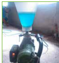
Die Verpressung erfolgt im Niederdruckverfahren mit der KÖSTER 1K-Injektionspumpe