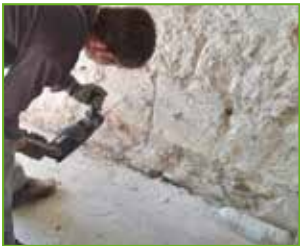
Alle 10 bis 15 cm wird bis 5 cm vor Mauerwerksende gebohrt