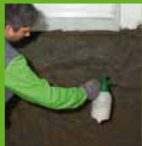
Grundieren mit KÖSTER Polysil TG 500

KÖSTER Sanierputze wurden eigens für die Instandsetzung von Mauerwerk mit hohem Salz- und Feuchtigkeitsgehalt entwickelt und sind WTA geprüft. Sie verhindern, dass Salze an die Oberfläche dringen. Wenn aufsteigende Feuchtigkeit mit KÖSTER Mautrol 2K gestoppt wurde, helfen sie bei der Trocknung der Wand und bei der Aufnahme der Salze, die beim Trocknungsprozess auskristallisieren.