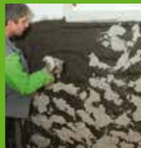
Aufbringen des KÖSTER Spritzbewurfs