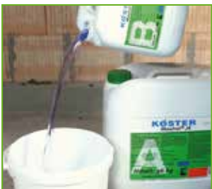
Beide Komponenten bis zum Erreichen einer homogenen Konsistenz vermischen