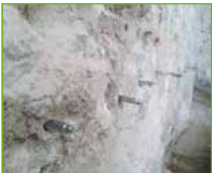
Der Bohrlochdurchmesser richtet sich nach den eingesetzten Packern