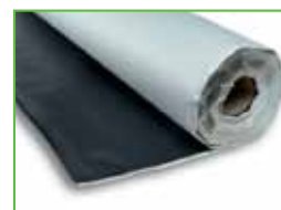
KÖSTER KSK AW 15