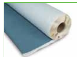
KÖSTER KSK SY 15