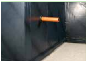
Izolacija je postavljena.