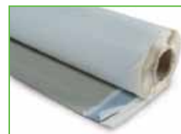
KÖSTER KSK ALU Strong